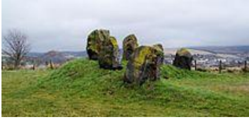
Die Dalmellingtonsteine. Ein 1999 errichtetes Denkmal der sieben Bergbau-Dörfer im Doon-Tal.